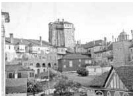
«Ιερά Μονή Βατοπεδίου»

Μα τα ωραία τελειώνουν γρήγορα. Επειδή έπρεπε να βιαστούμε και δεν είχαμε χρόνο να παρακαθήσουμε στην τράπεζα, πήραμε το συσσίτιο σε ξηρά τροφή και τραβήξαμε στον προορισμό που ήταν πάντα ο Άθως.