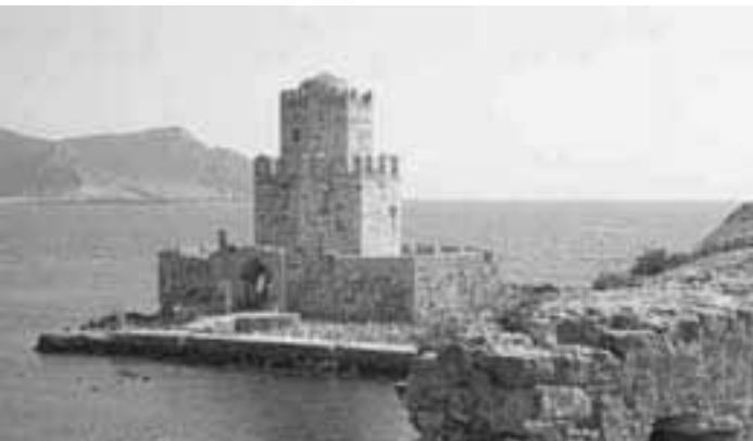
«Το Κάστρο της Μεθώνης»

Συντήρηση χρειάζονται, όχι αναπαλαίωση. Γιατί είναι φτιαγμένα από ιδρώτα, αίμα, σκληρή πέτρα και κόμα, όπως κι ο άνθρωπος.