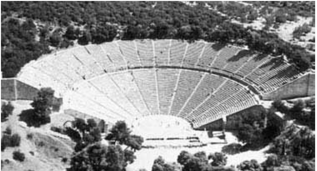
Άποψη του θεάτρου της Επιδαύρου

Έτσι έγινε και με την κωμωδία αυτή_ πολλοί την απόλαυσαν αλλά και πολλοί την απέρριψαν. Ο Λιγνάδης δεν πήρε το πρώτο βραβείο στο ανέβασμα αυτής της παράστασης, παρόλο που είχε πολλές πετυχημένες εμπνεύσεις.