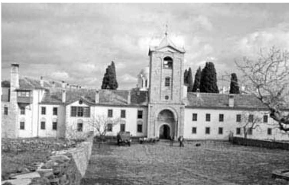
«Ιερά Μονή Προδρόμου»