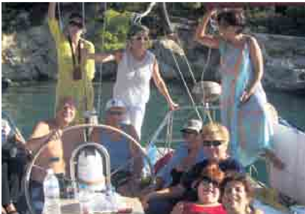
κι' άλλος καραβοκύρης!