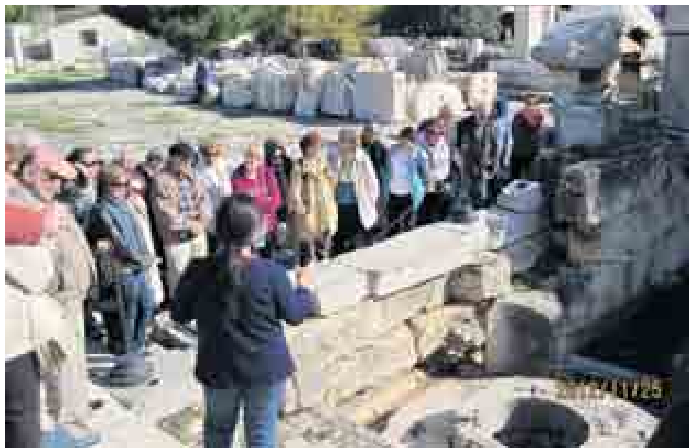
«Ξενάγηση στην Ελευσίνα»