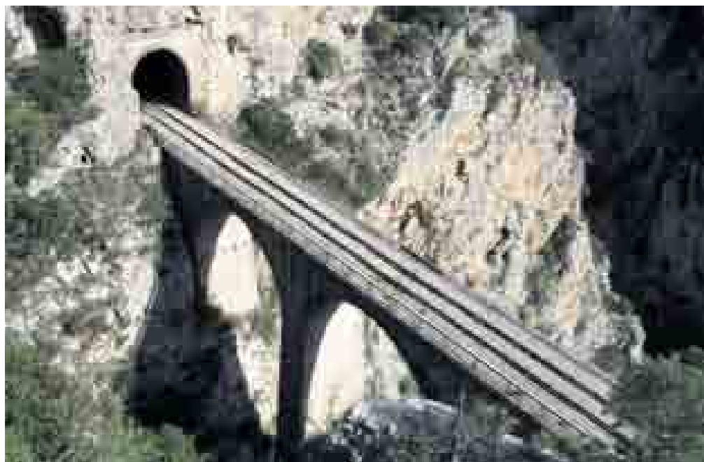
«Θέα από το μονοπάτι των σιδηροδρομικών»