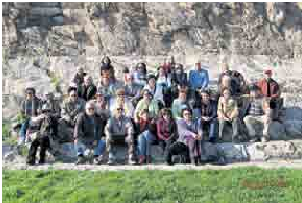
«Στον αρχαιολογικό χώρο της Ελευσίνας»