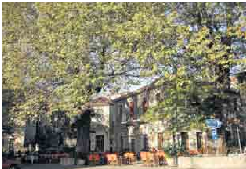
«Η πλατεία του Κοσμά»