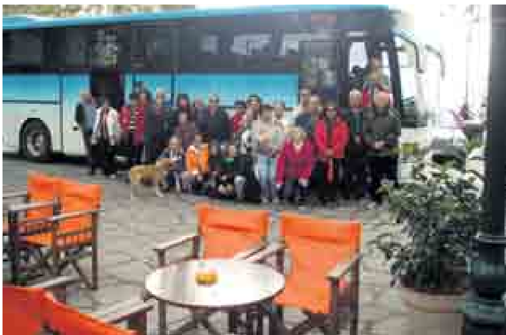
«Στην πλατεία του Κοσμά»