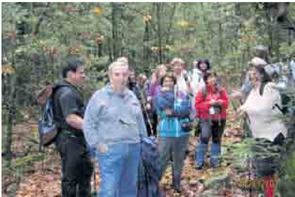
«Γλάτανος Ορεινής Ναυπακτίας»