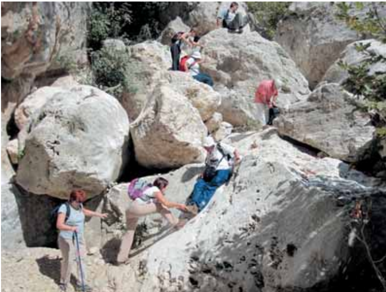
«Τα καλά κόποις κτώνται !»