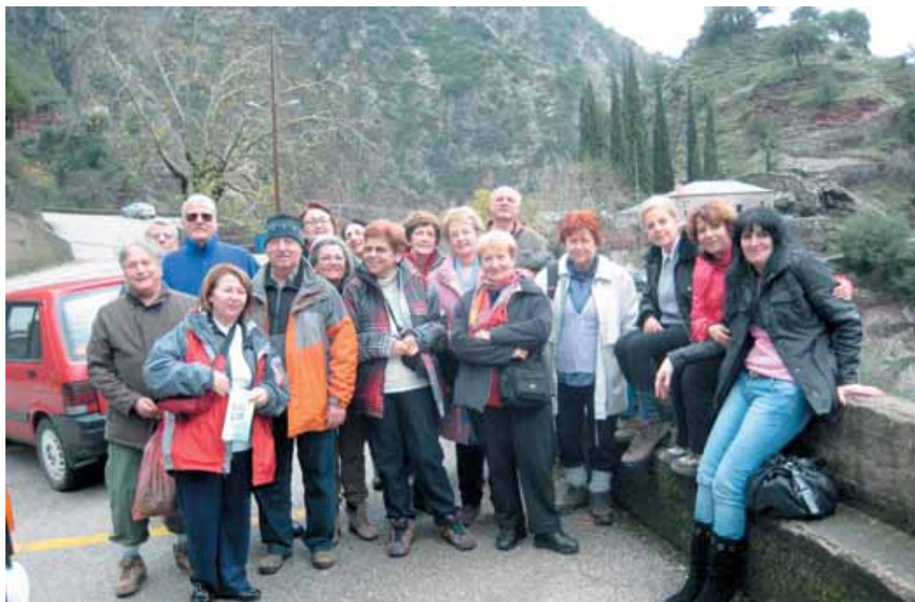
«Προς τον Προυσό»