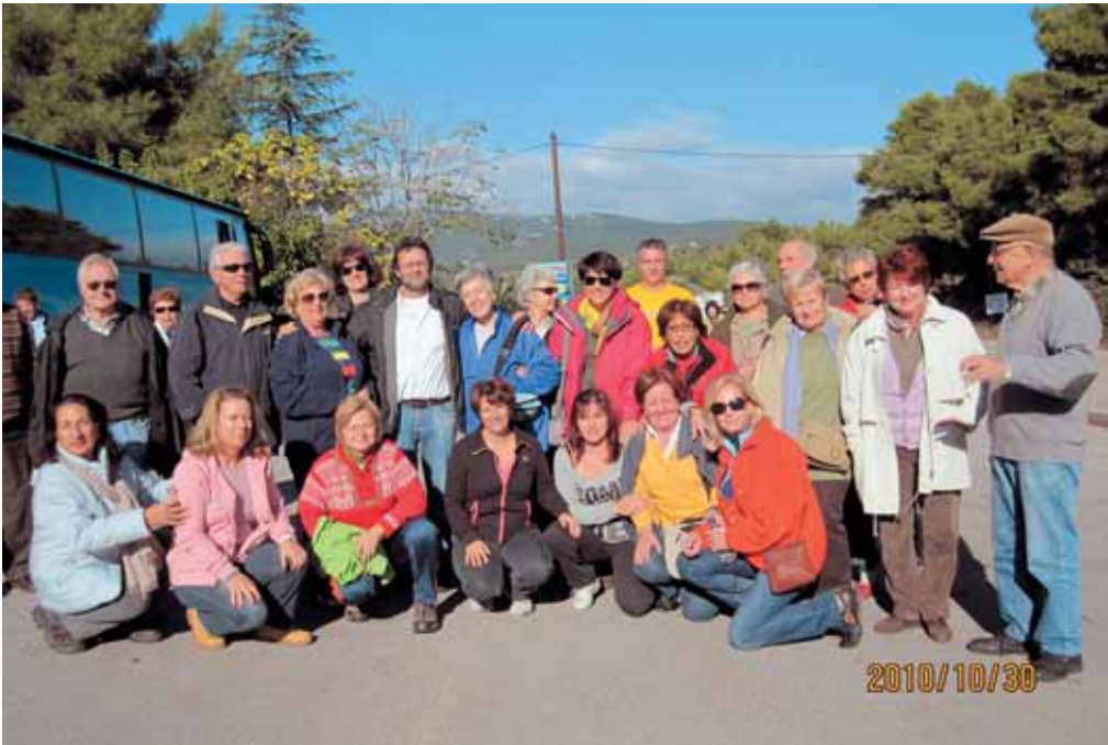
Από την εκδρομή μας στο Τελέθριο Ευβοίας (30 - 31 Οκτωβρίου 2010)