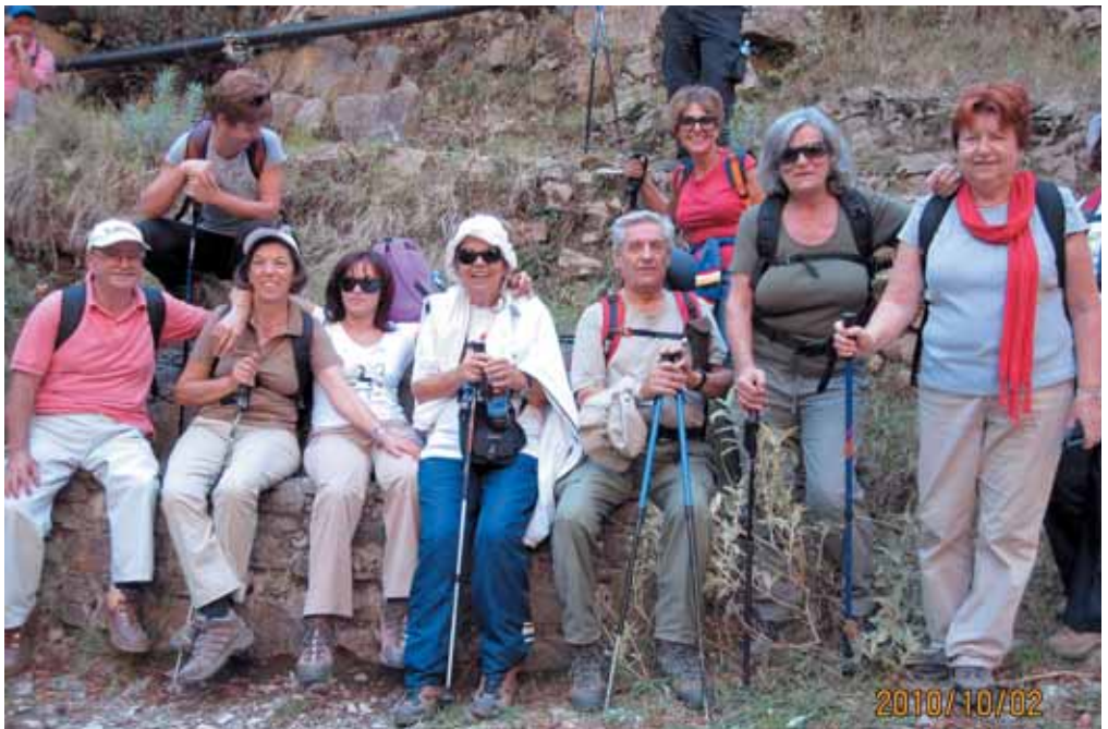
Φωτογραφίες: Ρόζα Αφεντάκη