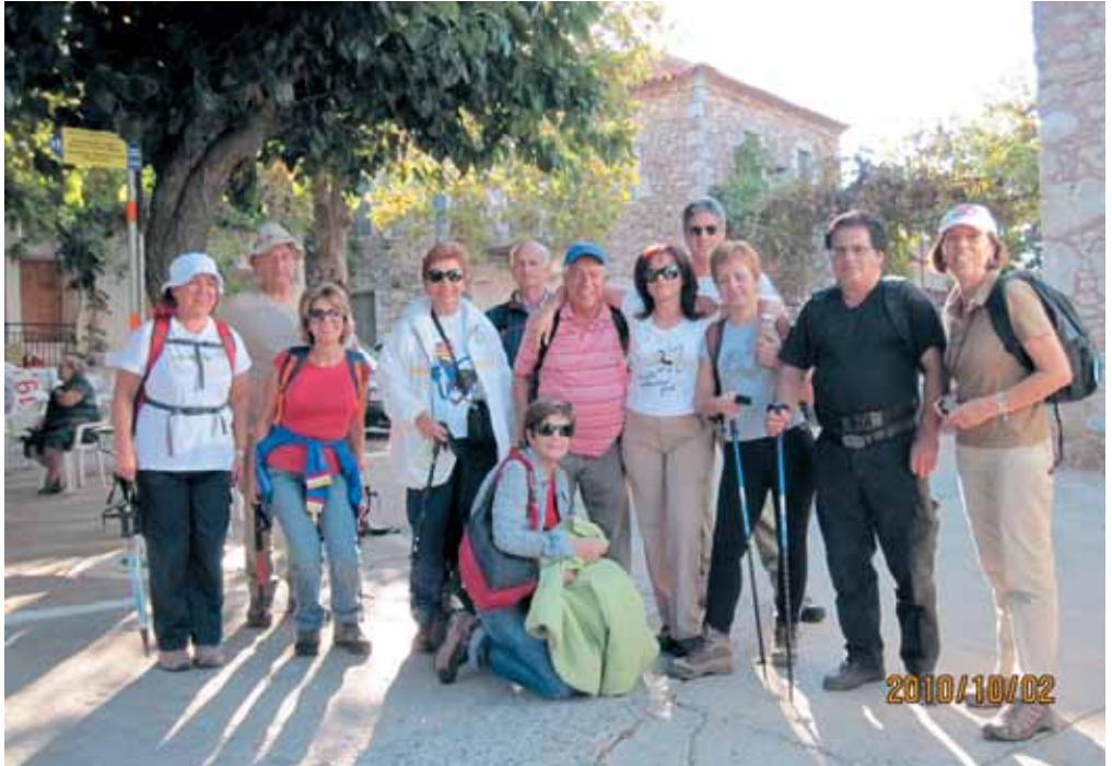
Από την εκδρομή μας στο Φαράγγι Ρίντομου (1 έως 3 Οκτωβρίου 2010)