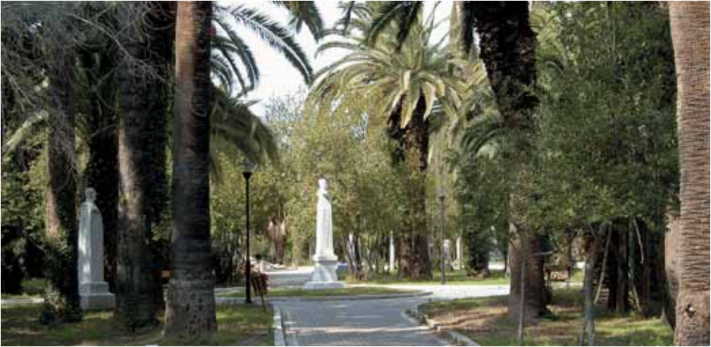
«Κήπος Ηρώων Μεσολογγίου»