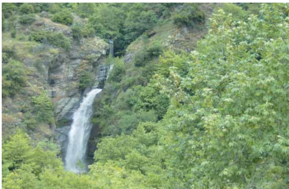
«Καταράκτες στο φαγάγγι «Σκεπασμένο» του Βελβεντού»