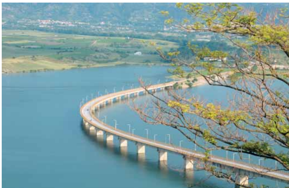
«Η γέφυρα του Αλιάκμονα»