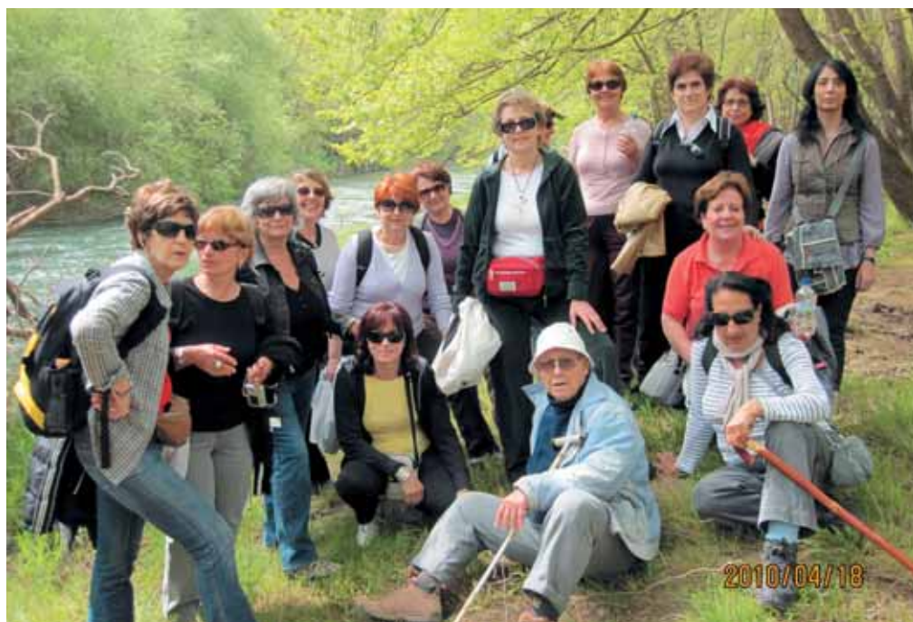
Από την εκδρομή μας στη Δάφνη Αχαΐας