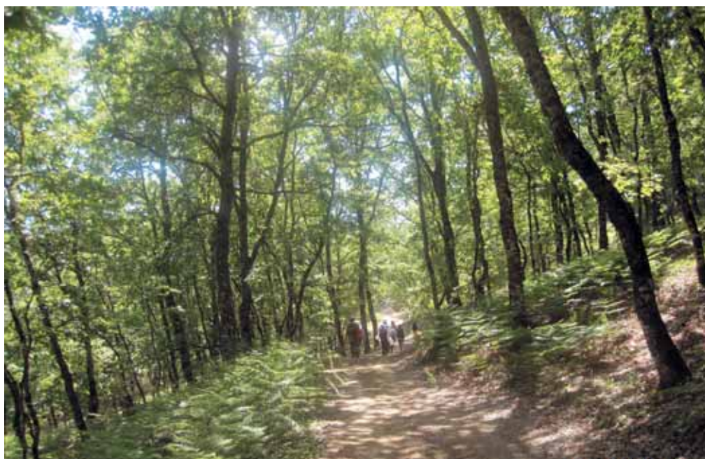
«Μονοπάτι στον Αράκυνθο»