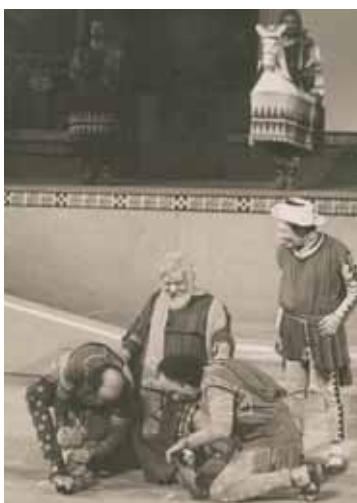
Από παράσταση του Εθνικού Θεάτρου στο Ωδείο Ηρώδου του Αττικού το 1976.

Με αυτή την κωμωδία, πολιτική σάτιρα, που θίγει ξεκάθαρα πολιτικά πρόσωπα, ο Αριστοφάνης καταφέρνει να κερδίσει το πρώτο βραβείο.