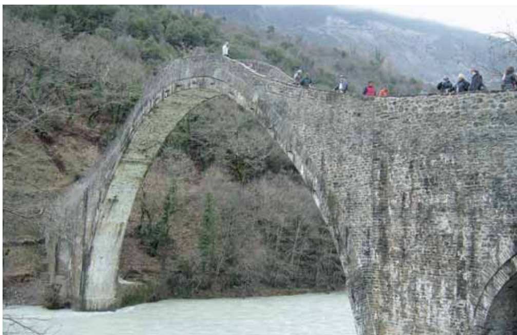
«Το γεφύρι της Πλάκας»