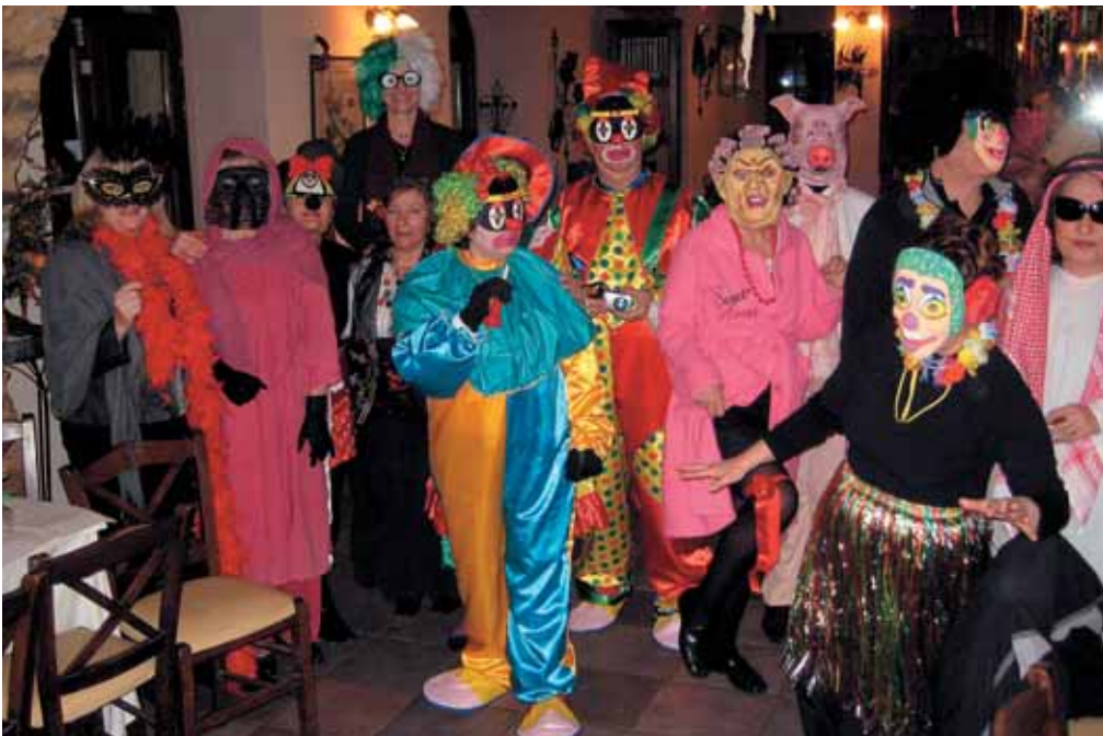
Χορός μεταμφιεσμένων στο Γύθειο