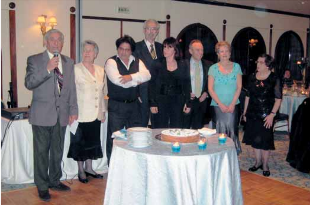
«Κοπή πίτας στο ξενοδοχείο ΠΛΑΖΑ