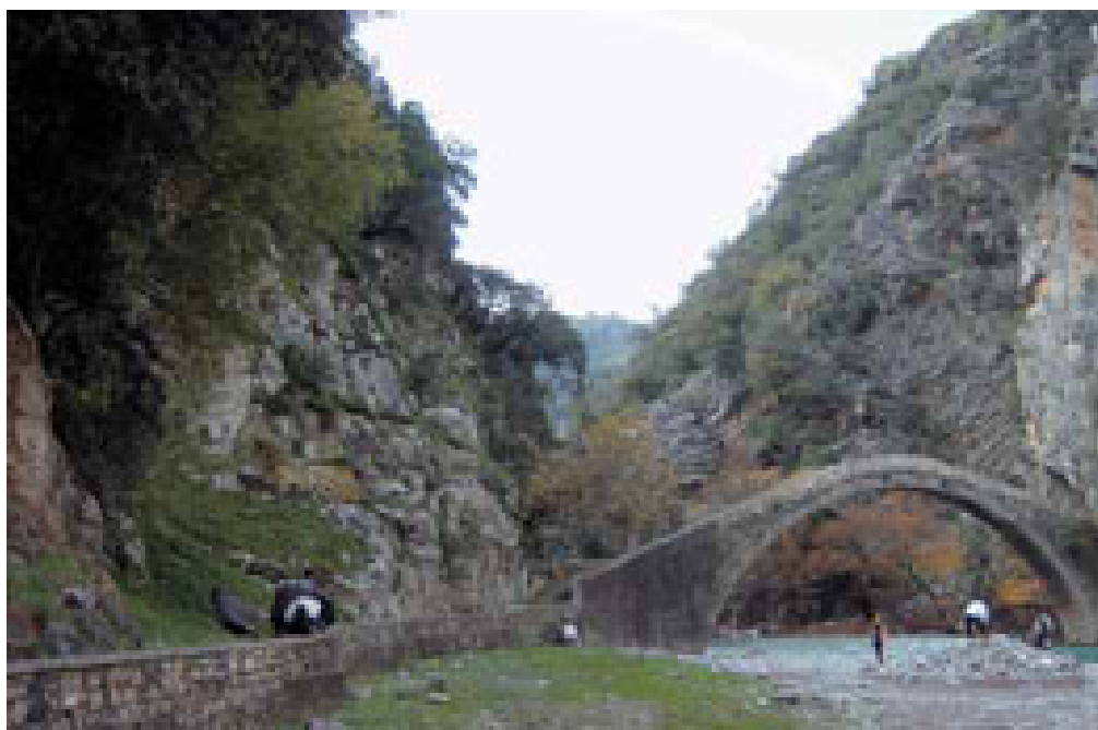
«Γεφύρι της Αρτοτίβας, Εύηνος - Αίτωλοακαρνανία»