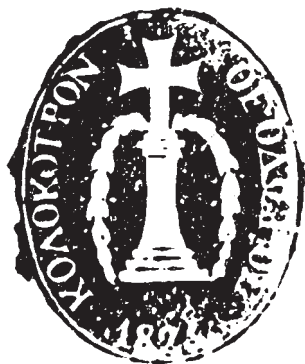
Ἡ σφραγίδα του Θ. Κολοκοτρώνη

Ἡ ἐπιστολή και η σφραγίδα εἶναι ἀπὸ το οικογενιακὸ ἀρχεῖο των ἀγωνιστῶν Δημητρακοπούλων Ἀλωνισταίνης