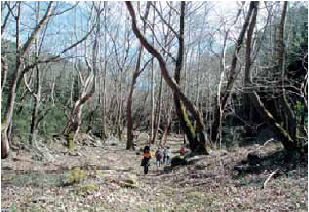
Από την εκδρομή στον Κίσαβο