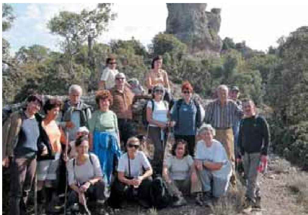
Από την εκδρομή στη Φολόη