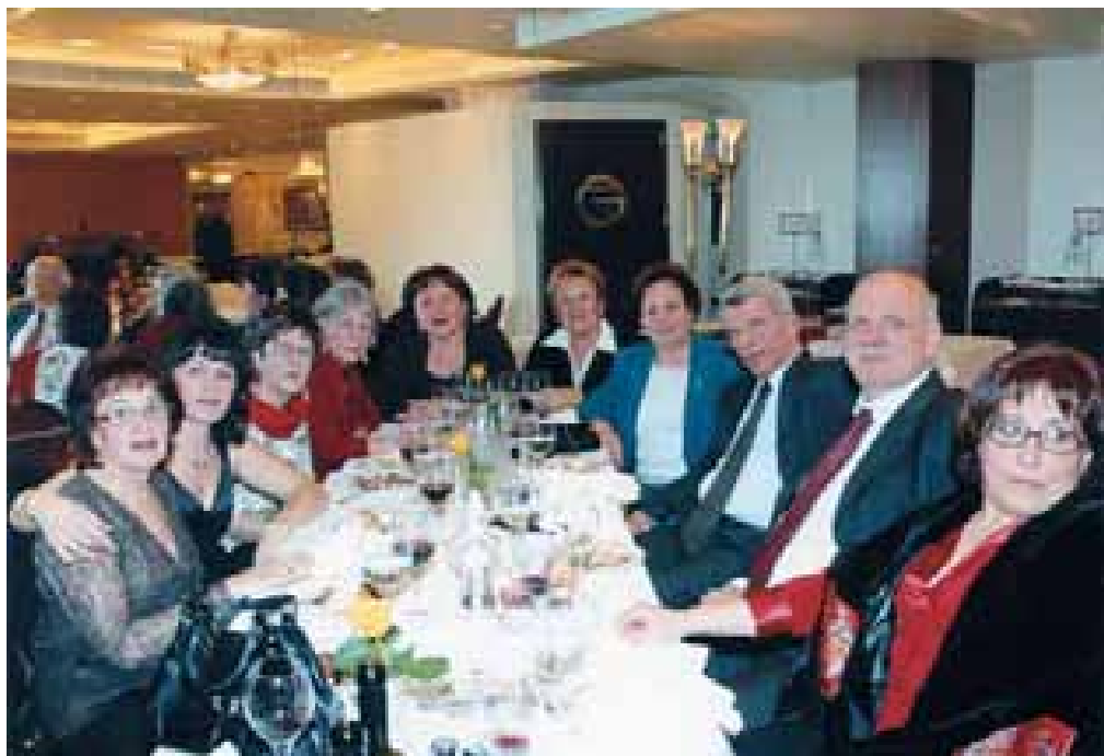
Από τον αποκριάτικο χορό του Αττικού στο ξενοδοχείο «Τιτάνια»