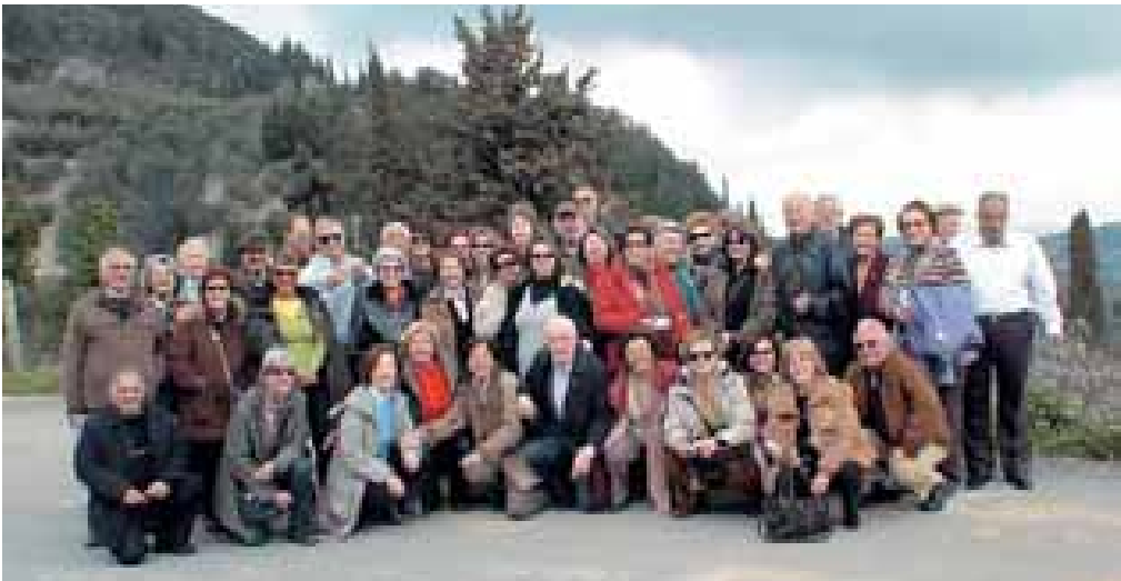
Από την εκδρομή της Καθαροδευτέρας στη Λευκάδα