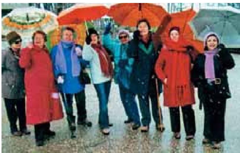
Από την χριστουγεννιάτικη εκδρομή μας στη Λίμνη Πλαστήρα.