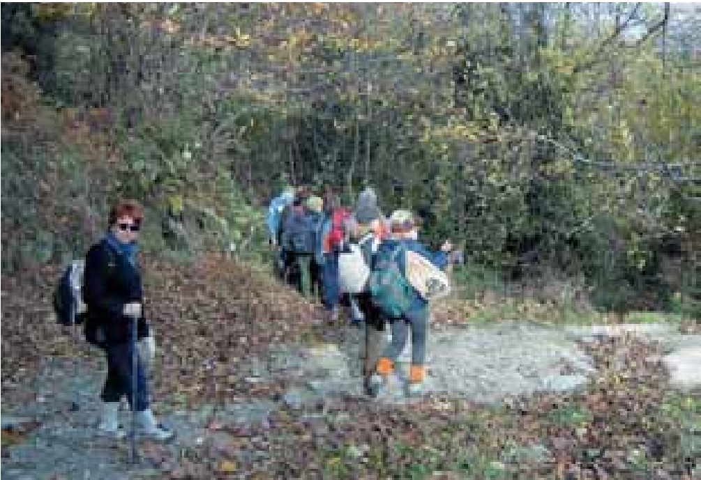
Από την εκδρομή στο Πήλιο

Την Κυριακή ευχαριστημένοι γυρίσαμε στην Αθήνα, αφήνοντας πίσω μας τους ανοιχτούς ασκούς του Αιόλου. Το χιονάκι που έπεφτε μας έφτιαχνε τη διάθεση για μια χαρούμενη επιστροφή.