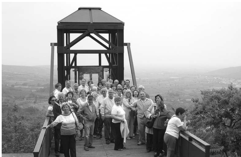
«Στο παλιό Κανναβουργείο της Έδεσσας»