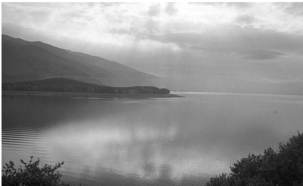
«Από τη λίμνη των Ιωαννίνων»

Πληροφορίες στο Σύλλογο. Δηλώστε έγκαιρα συμμετοχή.