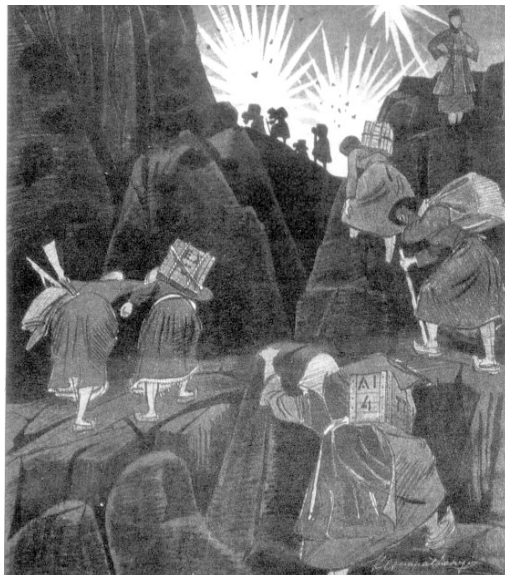
Οι ηρωίδες της Πίνδου (Αγνώστου)

Μ' αυτές αντροπατάγανε, ψηλά, πέτρα την πέτρα κι ανηφορίζαν στη γραμμή, όσο που μες τα σύγνεφα χάνονταν ορθομέτωπες η μια πίσω απ' την άλλη.