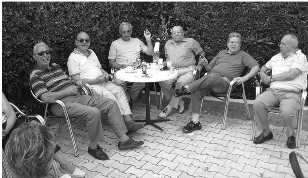
«Το αντρικό κλαμπ του Αττικού!»