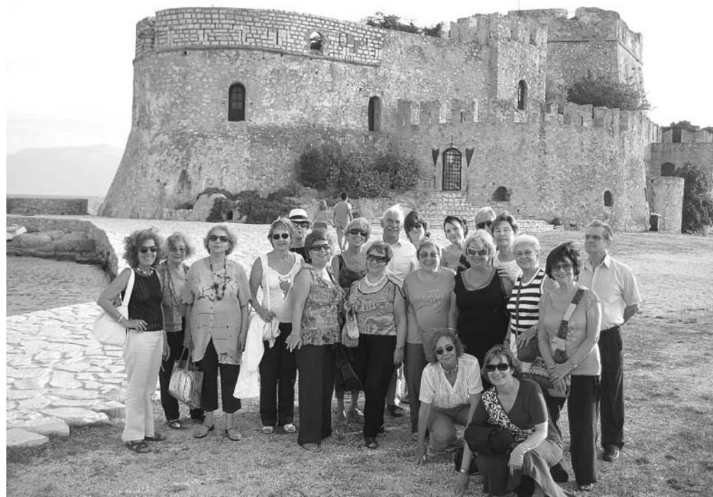
«Στο Μπούρτζι Ναυπλίου»