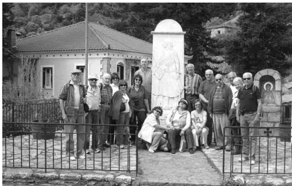
«Αλωνίσταινα - Μάιος 2007»