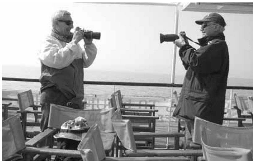
«Ο φωτογραφίζουν του φωτογραφίζοντος!»