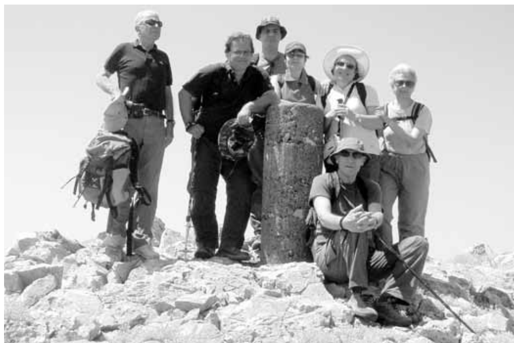
«Καντήλι Ευβοίας - Μάιος 2007»