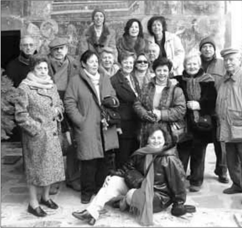
«Καστοριά - Χριστούγεννα 2006»