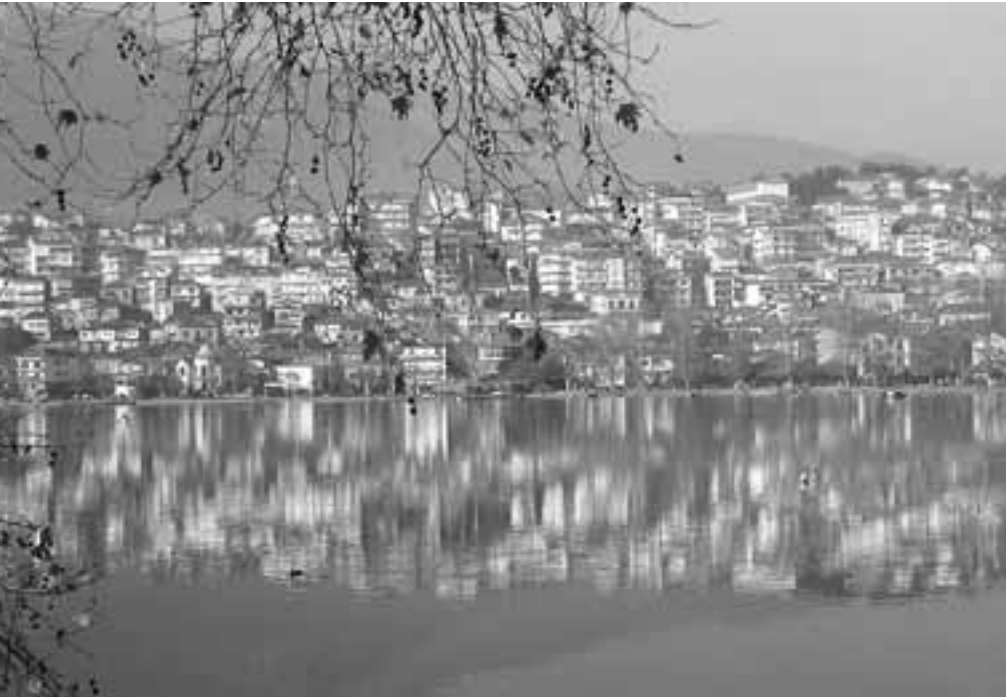
"Η ονειρική μαγεία της Λίμνης Καστοριάς"