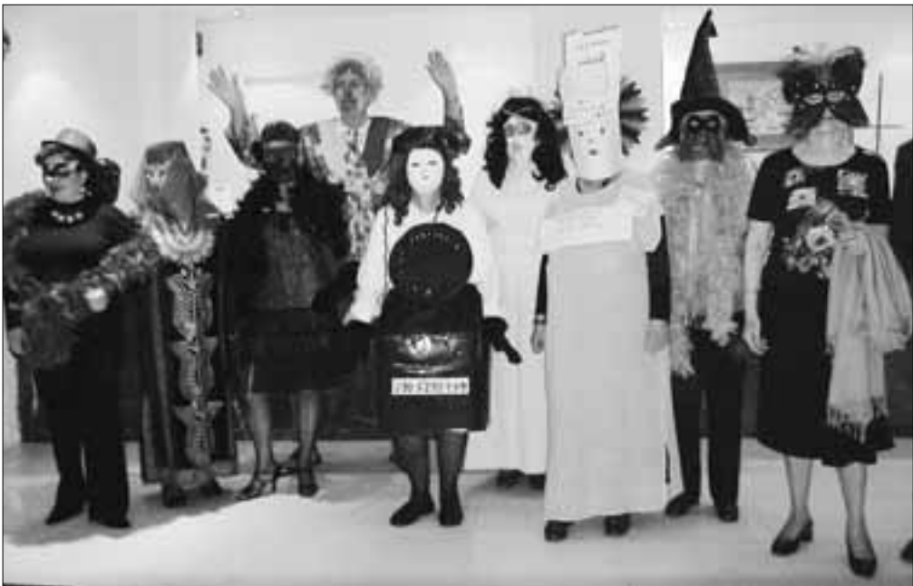
«Όπως πάντα πρωτοστάστες και πρωτότυποι!..»