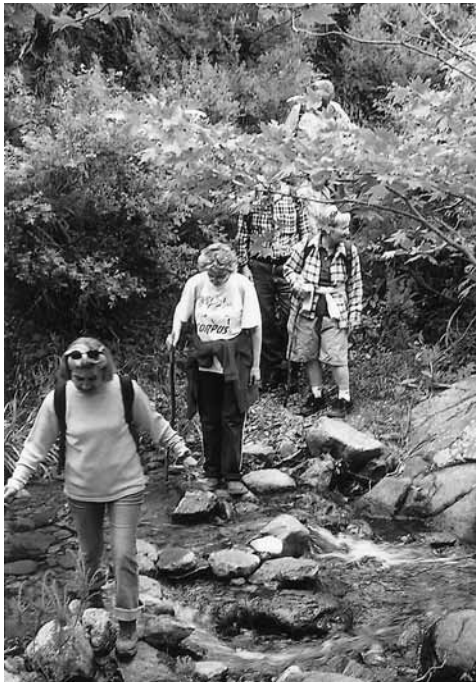
“Παθήματα ... απροσεξίας»