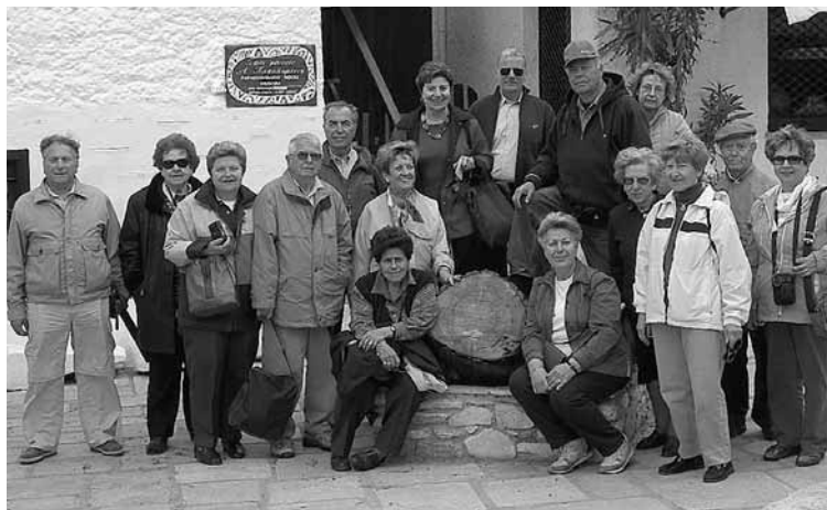
“Στο σπίτι του Παπαδιαμάντη - Σκιάθος»

Ετυμολογία της λέξης Περιστέρα (Περιστέρα= αρχαία ελληνική λέξη Περιστέρα= λέξη σημιακή perah-Istar= πουλί της Αφροδίτης