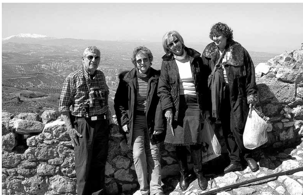
Από την Ακροκόρινθο Καθαροδευτέρα 2005