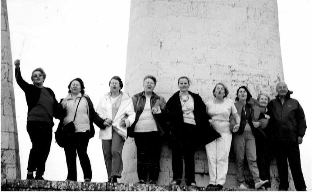
Ηρωϊκές “Αττικίνες” στο χορό του Ζαλόγγου