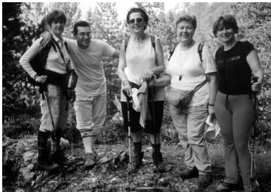
Όλυμπος 2004