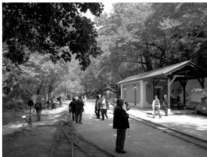
Μπλιές Πηλίου - Σταθμός τρένου